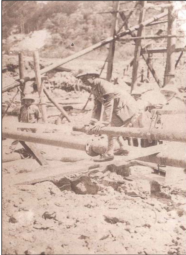
สมเด็จฯ กรมพระยาดำรงราชานุภาพ เสด็จตรวจการทำเมืองแร่ ที่เหมืองหนองเป็ดจังหวัดนครราชสีมา

ครั้งตั้งหลายวันจึงจะแล้ว เมื่อตั้งกรมป่าไม้ขึ้นแล้ว ถ้าพวกเขาป่าไม้เป็นคนในบังคับต่างประเทศขอรับมาทางกงสุล ข้าพเจ้าก็ทำตามแบบเดิมซึ่งมีจดหมายถึงกันหลายทอดตั้งว่ามาแล้ว ถ้าพวกเขาป่าไม้มาร้องขอต่อพวกเขาป่าไม้เอง จะเป็นคนในบังคับต่างประเทศหรือในบังคับไทย ข้าพเจ้าก็ให้กรมป่าไม้ส่งเคราะห์เสมอหน้ากัน ในไม่ช้าเท่าใดพวกเขาชาวต่างประเทศก็เลิกร้องขอทางกงสุล สมัยครมว่ากล่าวตรงต่อกรมป่าไม้หมด กงสุลจะว่าก็ไม่ได้ ด้วยพวกเขาป่าไม้อ้างว่าเข้าไม่ได้เกี่ยวข้องกับกรม ทำแต่การค้าขายอย่างไรสะดวกแก่กิจธุระของเขา เขาก็ทำอย่างนั้นการส่วนสงวนป่าไม้และเพิ่มผลประโยชน์แก่แผ่นดินก็ได้ตั้งพระราชประสงค์ทั้ง ๒ อย่าง จึงมีกรมป่าไม้สืบมา