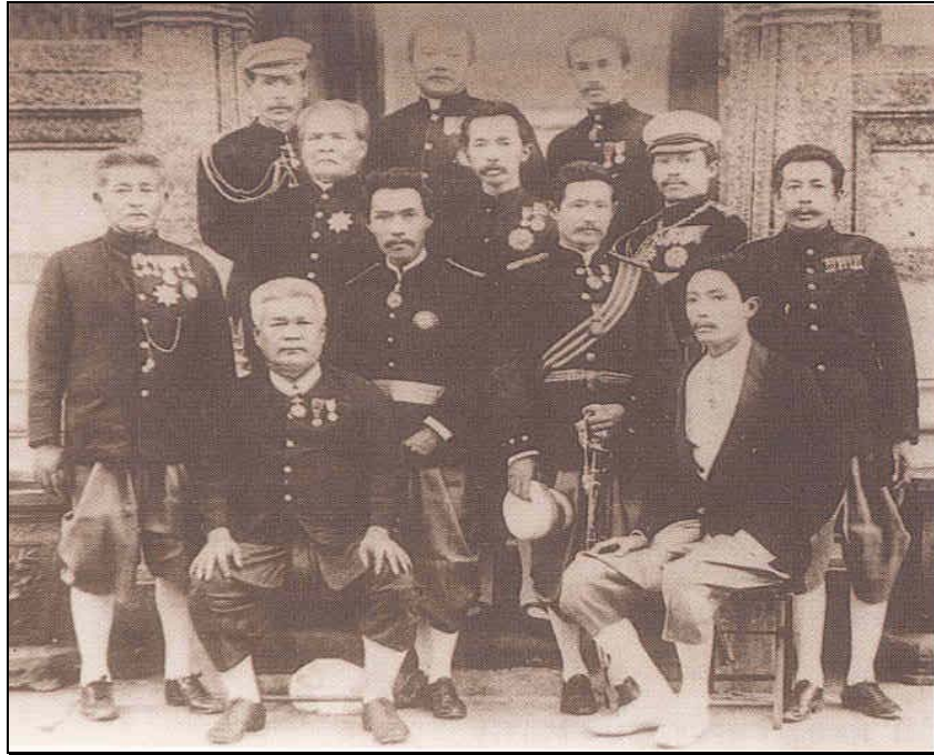
สมเด็จพระยาตราชานุภาพ ทรงฉายพระรูปนี้ เมื่อประชุมเสนาบดีกระทรวงมหาดไทยครั้งแรก เมื่อ พ.ศ. ๒๔๓๘ จาก ช่าย-ขวา