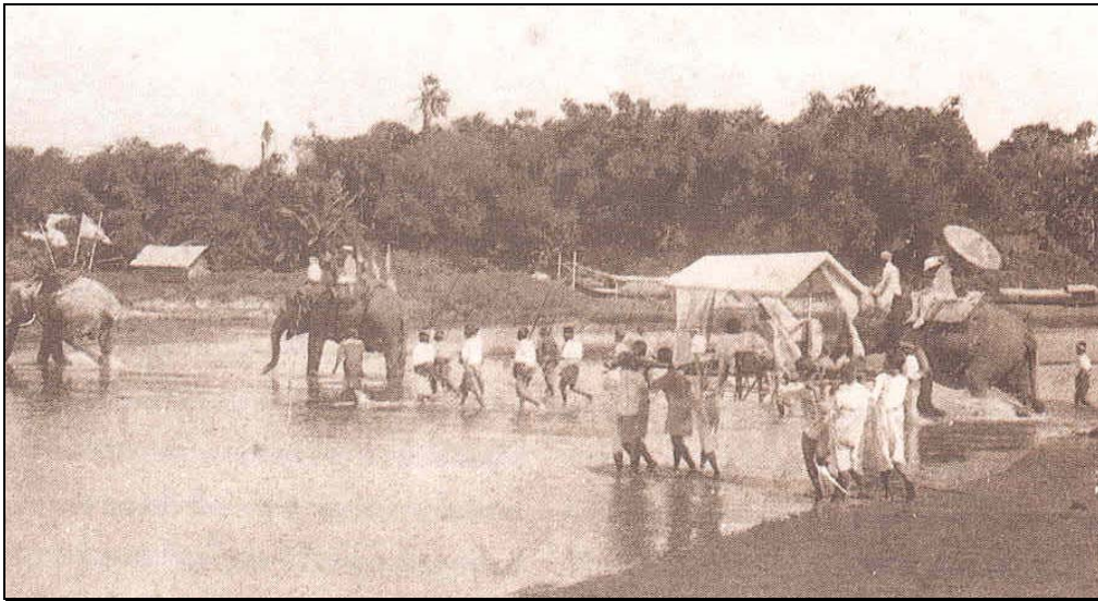
ขบวนเสด็จตรวจราชการขณะข้ามลำน้ำ มณฑลปัตตานี