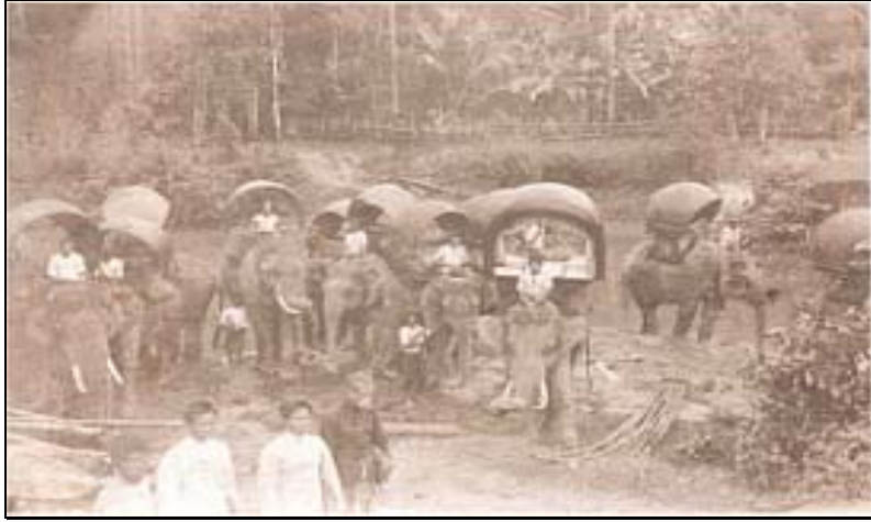
การเสด็จตรวจการทำงานรถไฟสายใต้ ของสมเด็จพระเจัฯ กรมพระยาดำรงราชานุภาพ