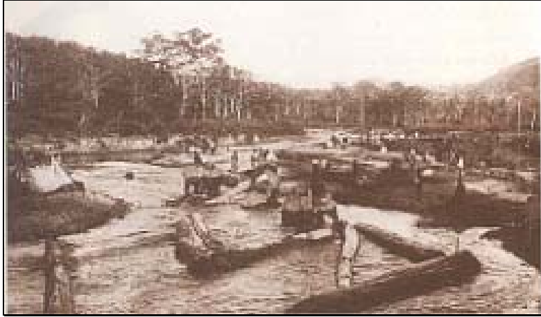
บริษัท อีสเอเชียติกแสดงวิธีการทำป่าไม้โดยใช้ช่างคัดซุงลงน้ำแม่คำมี ตำบลผาหมู๋ จังหวัดแพร่ เพื่อถวายสมเด็จพระเจ้าบรมวงศ์เธอ กรมพระยาภาณุพันธุวงศ์วรเดชทอดพระเนตรครั้งเสด็จตรวจราชการภาคเหนือ (สมัยรัชกาลที่ ๕)

ตามหัวเมืองแต่ก่อนมา นอกจากกรมอาทมาตที่กล่าวมาแล้ว ไม่มีพนักงานตรวจจับโจรผู้ร้าย กรมอาทมาตก็เป็นแต่สำหรับสืบข่าวทางเมืองพม่า เมื่อจัดการปกครองหัวเมืองพระเจ้าอยู่หัวโปรดให้เอาแบบ “ยองตามส์” ซึ่งควบคุมและใช้ปืนเหมือนอย่างทหารมาจัดขึ้นเป็นพนักงานตรวจจับโจรผู้ร้ายตามหัวเมือง เพราะเหมาะแก่การตรวจตระเวนท้องที่กว้างใหญ่ด้วยไม่ต้องใช้คนมากนัก แต่ชื่อที่จะเรียกยองตามส์ว่าอะไร ในภาษาไทยยังไม่มี ข้าพเจ้าจึงเอาชื่อตำรวจภูธรมาให้เรียกยองตามส์ที่จัดขึ้นมาใหม่ เพราะเห็นว่าหน้าที่เป็น ทำนองเดียวกันแต่โบราณ จึงมีกรมตำรวจภูธรอย่างใหม่ตั้งขึ้นแต่นั้นมา ต่อมาภายหลังข้าพเจ้าคิดจะจัดกรมตำรวจภูบาลเป็นกรมหนักสืบ C.I.D (ซี.ไอ.ดี.) ขึ้นอีกกรมหนึ่งแต่ไม่สำเร็จเพราะหาผู้เชี่ยวชาญเป็นครูไม่ได้ มาจนถึงรัชกาลที่ ๗ เมื่อสมเด็จพระเจ้าฟ้ากรมพระนครสวรรค์วรพินิตเป็นเสนาบดีกระทรวงมหาดไทยจึงทรงจัดขึ้น เมื่อกรมตำรวจภูธรรวมเป็นกรมเดียวกันเสียแล้ว จึงเรียกว่ากรมตำรวจกลาง