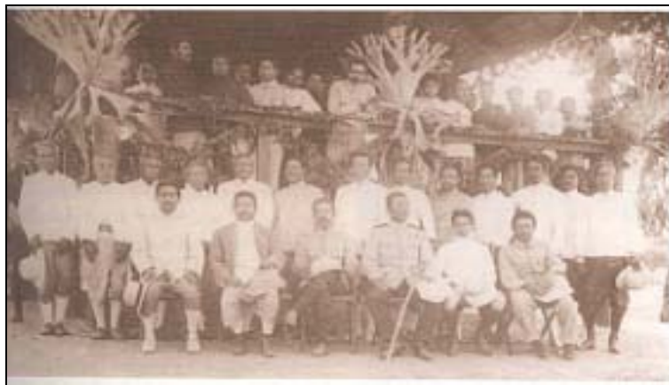
สมเด็จพระบรมโอรสาธิราชฯ ภายเสด็จตรวจราชการมณฑลอุดร พ.ศ. ๒๔๔๗

ตัวศาลาลูกขุนในฝ่ายซ้าย ซึ่งเป็นสำนักงานกระทรวงมหาดไทย ก็มีการเปลี่ยนแปลงหลายอย่าง เพราะเมื่อจัดห้องที่ทำงานเป็นระเบียบเรียบร้อยแล้วก็ที่ไม่พอ เมื่อข้าพเจ้ากลับจากตรวจหัวเมืองพบกับ กระทรวงกลาโหมตกลงกันแล้ว จึงไปบอกกระทรวงวังว่า กระทรวงกลาโหมยอมให้ห้องกลางศาลาลูกขุนแก่ กระทรวงมหาดไทย เพราะฉะนั้นขอให้ย้ายคลังวรรณไปเสียที่อื่น ก็ได้ห้องกลางมาใช้เป็นห้องที่ประชุม และ สำหรับการพิธีทำการพิธีและโดยปกติใช้เป็นห้องรับแขกด้วย ต่อมาอีกปีหนึ่งเมื่อกระทรวงกลาโหมบัญชา แต่ราชการทหารย้ายสำนักออกไปอยู่ที่ตึกกระทรวงกลาโหมเดี๋ยวนี้ ศาลาลูกขุนในทางฝ่ายขวาก็ตกมาเป็น สำนักงานกระทรวงมหาดไทย รวมอยู่ในกระทรวงเดียวหมดทั้งหมด ถึงกระนั้นก็ไม่พอกับกรมขึ้นจึงให้มา ทำงานร่วมสำนักกับสำนักกับกระทรวงมหาดไทยแต่กรมสรรพากรนอกเดี๋ยว นอกจากนั้นกรมตำรวจภูธรกับ กรมป่าไม้ต้องให้ทำที่ตั้งสำนักงานขึ้นใหม่ ส่วนกรมแรงงานอยู่ที่สำนักงานเดิมในกระทรวงเกษตรฯ