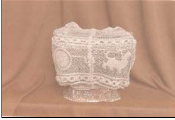
ภาพเตียงประดับมุกห่อด้วยผ้าตาข่ายดินทอง ปักเป็นรูปตราพระราชสีห์ และตราจักร ซึ่งใช้ใส่ ดวงตราประจำกระทรวงมหาดไทย รวม ๗ ดวง ปัจจุบันยังคงเก็บรักษาไว้ที่กระทรวงมหาดไทย

ยังมีอีกเรื่องหนึ่งซึ่งเกิดขึ้นเมื่อแรกข้าพเจ้าไปเป็นเสนาบดีกระทรวงมหาดไทยด้วยในวันแรกข้าพเจ้า ไปนั่งว่าการ เจ้าพระยารัตนบดินทร์ท่านให้เสมียนตราเชิญตราจักรกับตราพระราชสีห์สำหรับตำแหน่งเสนาบดี กระทรวงมหาดไทยมาส่งให้ข้าพเจ้าที่ศาลาลูกขุน ดวงตรารวมกันอยู่ในกล่องเงินใบหนึ่ง ดูเป็นของทำที่ เชียงใหม่ไม่มีเศษอันใด แต่เสมียนตราบอกว่ากล่องใส่ดวงตรานั้นเป็นของเสนาบดีต้องหามาเมื่อแรกรับดวง ตรา และครั้งสมเด็จพระเจ้าฟ้ากรมสมเด็จพระบารามปรปักษ์เป็นเสนาบดีกระทรวงมหาดไทยทรงใช้กล่องกระ (หรือกล่องถมข้าพเจ้าจำไม่ได้แน่) ครั้นเจ้าพระยารัตนบดินทร์เป็นตำแหน่งเอกกล่องเงินใบนี้มารับตราไปแต่ แรก ขอให้ข้าพเจ้าหาอะไรมาใส่ดวงตราจะได้คืนกล่องเงินให้เจ้าพระยารัตนบดินทร์ ข้าพเจ้าตอบว่าข้าพเจ้าไม่ รู้ว่าเสนาบดีจะต้องหาอะไรมาใส่ตรา ไม่ได้เตรียมไว้จะอย่างไรก็ขอยืมกล่องเงินของเจ้าพระยารัตนบ ดินทร์ไว้ก่อนไม่ได้หรือ เสมียนตราจึงบอกว่ามีเตียงประดับมุกของเก่าอยู่บนเพดานไป ๑ ดูเหมือนจะเป็น ของเดิมที่สำหรับใส่ตรา ข้าพเจ้าให้ไปหยิบลงมาดู เห็นลวดลายประดับมุกเป็นแบบเก่า ถึงชั้นรัชกาลที่ ๑ หรือ ที่ ๒ ก็ตระหนักใจว่าจริงดังว่า จึงสั่งให้กลับไปใช้เตียงใบนั้นใส่ตราตามเดิมแล้วสั่งให้เสมียนตราหากำปั่นเหล็ก สาเก็บตราไว้ในศาลาลูกขุน จึงเป็นอันเลิกประเพณีที่เสนาบดีเอาตราตำแหน่งไปไว้ที่บ้านอีกอย่างหนึ่ง