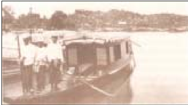
ภาพเรือ "ยอดไชยา" ซึ่งเป็นเรือของสมเด็จพระยาดำรงราชานุภาพ ที่ใช้เสด็จตรวจราชการหัวเมือง

ข้าพเจ้าไปตรวจหัวเมืองครั้งนั้น ได้เห็นประเพณีการปกครองหัวเมืองอย่างโบราณที่ยังใช้อยู่หลายอย่างควรจะเล่าเข้าไปในโบราณคดีได้ แต่ต้องเล่าประกอบกับวินิจฉัยอันเป็นความรู้ซึ่งข้าพเจ้าได้ต่อเมื่อภายหลังด้วย จึงจะเข้าใจชัดเจน