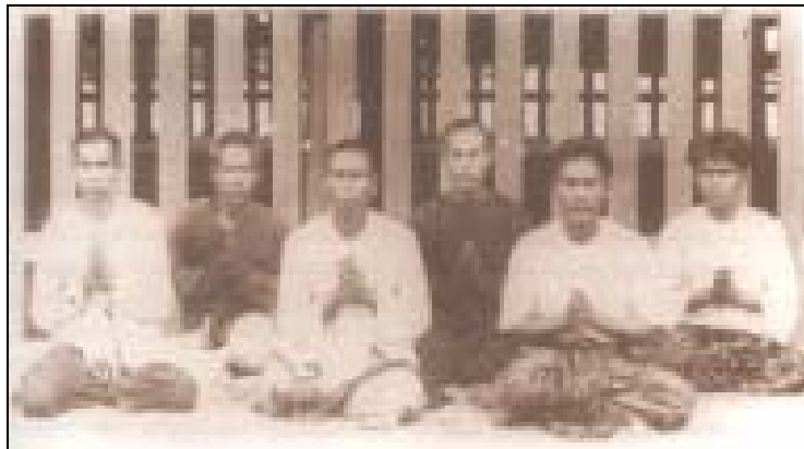
พวก "อั้งยี่" ที่ถูกจับกุม ส่งฟ้องศาล

อุดหนุนกิจการต่างๆ ให้เป็นประโยชน์แก่ผู้อื่น จึงเข้ากับชาวเมืองได้ทุกชั้น ตั้งแต่เจ้าเมืองกรมการตลาจนราษฎร