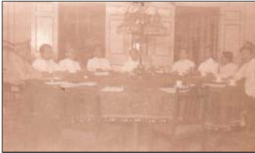
พระบาทสมเด็จพระจุลจอมเกล้าเจ้าอยู่หัว ทรงเป็นประธานในการประชุมเสนาบดี ณ พระที่นั่งวิมานเมฆ พระราชวังดุสิต

ทำงานอยู่ในศาลาลูกขุนได้เงินเดือน แต่พวกที่ทำงานอยู่ที่อื่น เช่น ขุนศาลตุลาการศาลอุทธรณ์ความหัวเมือง ซึ่งตั้งศาลอยู่ที่บ้านเสนาบดี คงได้ค่าธรรมเนียมเป็นผลประโยชน์อยู่อย่างเดิม แม้ตัวเสนาบดีทั้ง ๒ กระทรวงก็ คงได้ค่าธรรมเนียมเป็นผลประโยชน์อยู่อย่างเดิม เพราะไม่ได้เข้ามาตั้งประจำทำงานในศาลาลูกขุน ตัว ข้าพเจ้าเป็นเสนาบดีกระทรวงมหาดไทยคนแรกที่ได้รับแต่เงินเดือน ไม่ได้ค่าธรรมเนียมเหมือนท่านแต่ก่อน แต่เมื่อกระทรวงมหาดไทยและกระทรวงกลาโหมขึ้นทำงานบนศาลาลูกขุนใหม่แล้วไม่มีใครในกระทรวงทั้ง ๒ นั้นคิดหรือสามารถจะแก้ไขระเบียบการให้เจริญทันสมัยได้ ก็คงทำการงานอยู่ตามแบบเดิมเหมือนเช่นเคยทำ ที่ศาลาลูกขุนเก่าสืบมา จนข้าพเจ้าเป็นเสนาบดีกระทรวงมหาดไทย ข้าพเจ้าจึงได้เห็นแบบเก่าว่าทำกันมา อย่างไร