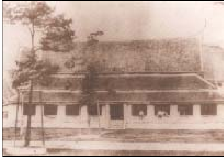
ศาลาลูกขุนใน ในสมัยรัชกาลที่ ๓ เป็นอาคารก่ออิฐถือปูน ชั้นเดียว ๒ หลังคู่กัน ใช้เป็นสำนักงานกระทรวงมหาดไทยหลังหนึ่ง และกระทรวงกลาโหมหลังหนึ่ง จนถึงสมัยปฏิรูประบอบราชการครั้งใหญ่ ในสมัยรัชกาลที่ ๕

ข้าราชการพลเรือน อีกหลังหนึ่งซึ่งอยู่ข้างขวาสำหรับประชุมข้าราชการทหารที่อยู่ในปกครองของเสนาบดี กระทรวงกลาโหมด้วยเป็นหัวหน้าข้าราชการทหารเช่นเดียวกัน