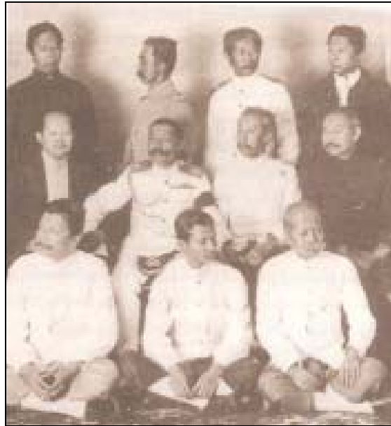
เสนาบดีกระทรวงต่างๆ ภาพถ่ายฝีพระหัตถ์ของพระบาทสมเด็จพระจุลจอมเกล้าเจ้าอยู่หัว จาก ซ้าย-ขวา แถวหน้า

กับทั้งกรมพยาบาลและกรมพิพิธภัณฑสถานซึ่งเป็นกรมอิสระอยู่ก่อน เข้ากับกรมศึกษาธิการยกขึ้นเป็น “กระทรวงธรรมการ” และทรงพระกรุณาโปรดให้ข้าพเจ้าย้ายขาดจากตำแหน่งผู้ช่วยผู้บัญชาการทหารบกใน กรมยุทธนาธิการมาเป็นอธิบดีกระทรวงธรรมการแต่ตำแหน่งเดียว เมื่อต้น พ.ศ. ๒๔๓๓ ข้าพเจ้าจึงได้รับ ราชการแต่ฝ่ายพลเรือนทางเดียวแต่นั้นมา