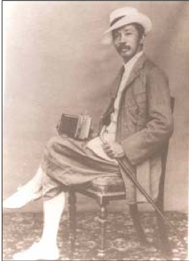
สมเด็จพระยาตำรากราชานภาพ ทรงฉายพร้อมกล้องคู่พระหัตถ์