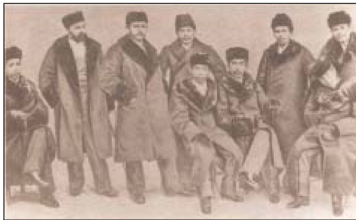
เมื่อปี พ.ศ. ๒๔๓๔ พระบาทสมเด็จพระจุลจอมเกล้าเจ้าอยู่หัว ทรงพระกรุณาโปรดเกล้าฯ ให้กรมหมื่นดำรงราชานุภาพ เป็นผู้แทนพระองค์เสด็จไปเยี่ยมพระเจ้าซาร์นิโคลัสที่ ๒ เมื่อครั้งยังทรงเป็น ซาร์เวนิชนิโคลัส แห่งรัสเซีย ภาพนี้ทรงฉายร่วมกับคณะทูตพิเศษ ที่ประเทศรัสเซีย

เมื่อพระเจ้าอยู่หัวทรงทดลองระเบียบการที่จะจัดใหม่อยู่ถึง ๓ ปี ในระหว่างนั้นเมื่อต้น พ.ศ. ๒๔๓๔ เจ้าซาร์เวนิช รัชทายาทประเทศรัสเซีย (ซึ่งภายหลังได้เสวยราชสมบัติเป็นพระเจ้านิโคลัสที่ ๒) เข้ามาเฝ้าถึงเดือนกรกฎาคมในปีนั้น พระเจ้าอยู่หัวก็โปรดให้ตัวข้าพเจ้าเป็นราชทูตพิเศษไปเยี่ยมตบเจ้าซาร์เวนิชแทนพระองค์ ตั้งได้เส้ามาแล้วในนิทานที่ ๕ เรื่องของประหลาดที่เมืองชัยปุระ ข้าพเจ้าไปยุโรปครั้งนั้นได้รับพระราชทานอนุญาตให้ไปยังประเทศอียิปต์และอินเดียเมื่อขากลับ เพื่อจะได้หาความรู้ประกอบกับที่ได้ไปเห็นในยุโรปมาทำการงานให้เป็นประโยชน์ด้วย ข้าพเจ้าก็ตั้งหน้าหาความรู้เรื่องที่จะเป็นประโยชน์แก่กระทรวงธรรมการตลอดทางที่ไปครั้งนั้น ข้าพเจ้ากลับมาถึงกรุงเทพฯ เมื่อปลายเดือนมีนาคมมาถึงได้ ๗ วัน ก้อออก