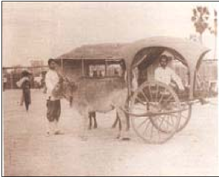
สมเด็จพระยาดำรงราชานุภาพประทับในประเทาะ เมื่อคราวเสด็จตรวจมณฑลอีสาน จังหวัดอุบลราชธานี พ.ศ. ๒๔๔๙

ถึงหากว่าพวกเราข้าราชการมหาดไทยจะได้รับความภาคภูมิใจและชื่นชมยินดีอยู่บ้างใน พ.ศ. ๒๔๓๕ เพราะเป็นกระทรวงมหาดไทยแรกตั้งแรกมีขึ้นในประวัติของชาติไทยที่ได้สร้างบ้านสร้างเมืองมาแต่โบราณกาล ถึงกระนั้นก็ดี เมื่อตั้งต้นเป็นกระทรวงขึ้นนั้น พวกเราคนใหม่ที่เข้ารับราชการชั้นต้นมีแต่ 3 คนคือ สมเด็จเสนาบดี ข้าพเจ้า และพระมนตรีพจนกิจ คือ เจ้าพระยาพระเสด็จฯ เรายังทันตั้งตัว ผู้ที่รู้ภาษาฝรั่งก็มีแต่สมเด็จเสนาบดีและข้าพเจ้า และมีแต่ข้าพเจ้าเป็นผู้รู้จักหัวเมืองชายแดนด้วยไปยากลำบากทำแผนที่มาแล้ว เมื่อตั้งกระทรวงขึ้น เราเป็นคนใหม่ไม่รู้จักคุ้นเคยใคร แม้จะมีข้าราชการเก่าๆที่โอนจากศาลลูกขุนในฝ่ายซ้ายมาร่วมกันอยู่ก็จริง แต่โดยมากท่านรู้จักกรุงเทพฯ ไม่รู้จักเมืองที่ไกลออกไป ยิ่งเป็นเมืองชายแดนแล้วเป็นแต่ทราบชื่อไม่รู้ว่าอยู่ที่ไหนแน่ แม้แต่จะชี้ในแผนที่ก็ชี้ไม่ใคร่ถูก อย่าไปนึกถึงเลยที่ท่านจะรู้ภาษาฝรั่งหรือเรื่องของฝรั่งที่มารบกวนเราอยู่ชายแดนทั้งทางตะวันออกและตะวันตก ที่เราจะต้องพูดจาโต้เถียงกับเขาในเวลานั้น