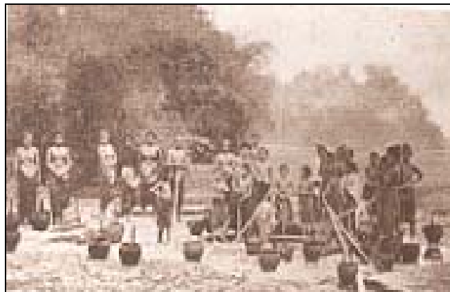
สภาพความเป็นอยู่ของชาวบ้านในมณฑลอีสานในสมัยรัชกาลที่ ๕ เมื่อครั้ง สมเด็จพระยาดำรงราชานุภาพเสด็จตรวจราชการ พ.ศ. ๒๔๔๙