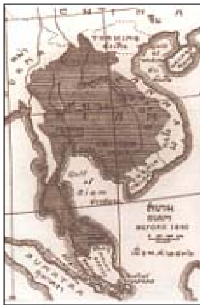
แผนที่แสดงอาณาเขตประเทศไทย เมื่อปี พ.ศ. ๒๔๓๖ (ร.ศ. ๑๑๒)

พอเรานั่งทำงานได้ไม่ถึงปี ก็เกิดเรื่องกับฝรั่งเศส ทางลุ่มแม่น้ำโขง ใน ร.ศ. ๑๑๒ (พ.ศ. ๒๔๓๖) เวลานั้นเรามี กองข้าหลวงไปตั้งอยู่ทางลุ่มแม่น้ำโขง คือ พระเจ้าน้องยาเธอ กรมหลวงประจักษ์ศิลปาคม ทรงดำรงตำแหน่งข้าหลวง ต่างพระองค์สำเร็จราชการอยู่ที่บ้านเดื่อ หมากแข้ง คือเมืองอุดรธานีเดี๋ยวนี้นี้เรียกว่าข้าหลวงลาวพวน พระเจ้าน้องยา เธอ กรมหลวงพิชิตปรีชากร ทรงดำรงตำแหน่งข้าหลวงต่างพระองค์ สำเร็จราชการลาวกาว กับกองข้าหลวงอยู่ที่ จังหวัดอุบลราชธานี เรียกว่า ข้าหลวงลาวกาว กองข้าหลวงลาวกาวอีกกองหนึ่งประจำเมืองนครจำปาศักดิ์มีพระพิศณุ เทพเป็นข้าหลวงอยู่แล้วตั้งนี้ก็ดี แต่ล้วนเป็นข้าราชการที่เรียกได้ว่ายังไม่รู้จักกับมหาดไทยใหม่ในด้านความคิดและ นโยบาย เราได้แต่มีอะไรมาก็ำความกราบถวายบังคมทูลพระบาลสมเด็จพระเจ้าอยู่หัว ขอพระราชทานพระราชดำริ เมื่อพระราชทานกระแสมาอย่างไรเราก็จัดส่งไปและเมื่อมีสิ่งใดเกิดขึ้น ก็นำความกราบบังคมทูลเรียนพระราชปฏิบัติอีก ในระยะนี้พระบาทสมเด็จพระเจ้าอยู่หัวทรงเหน็ดเหนื่อยมาก จนถึงกับต้องเสด็จมาประทับในกระทรงมหาดไทยทั้ง กลางวันและกลางคืนหลายวัน จนเหตุการณ์ค่อยสงบ