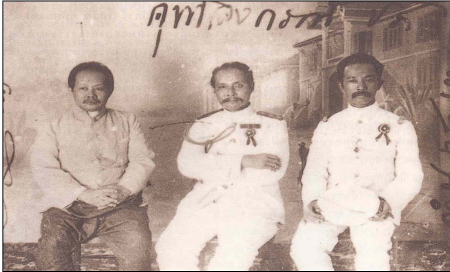
พระบาทสมเด็จพระจุลจอมเกล้าเจ้าอยู่หัว ทรงฉายพระบรมรูปร่วมกับ สมเด็จพระยาเทววงศ์วโรปการและสมเด็จพระยากรมพระยาดำรงราชานุภาพ ที่ร้านถ่ายรูปหลวงในงานประจำปี วัดเบญจมบพิตร พ.ศ.๒๔๔๖ โดยมีพระราชดำรัสว่า "มือซ้ายขวามาถ่ายรูปด้วยกัน"

เป็นคนไทยทั้งมวล มีเกียรติแผ่ไพศาลไปทั่วพิภพเป็นที่เคารพนับถือของนานาประเทศ คนไทยผู้ปกครองประเทศที่ได้รับภาระต่อมาในเวลานี้ ๓ พระองค์ได้เสด็จสวรรคตและสิ้นพระชนม์ไปแล้ว ต่อมาก็ได้เจริญรอยพระยุคลบาทรักษาจัดการปกครองบ้านเมืองให้เหมาะสมแก่กาลสมัยตั้งรุ่งเรืองมาถึง พ.ศ.๒๔๙๕ ให้เป็นมรดกตกทอดต่อไปภายหน้าเช่นนี้เราไทยควรยินดีพร้อมสามัคคีช่วยกันรักษาทำการบ้านการเมืองต่อไปให้ได้เช่นที่บรรพบุรุษของเราได้ทำไว้ให้เป็นมรดกนั้น